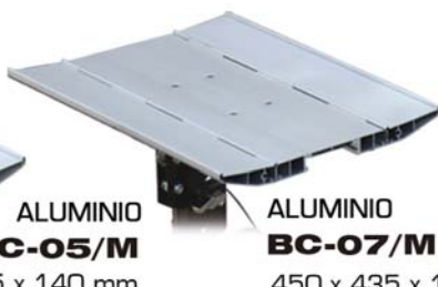
ALUMINIO BC-07/M 450 x 435 x 140 mm