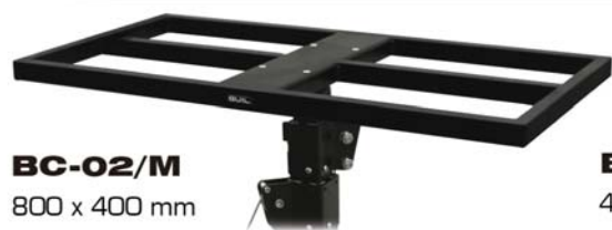
BC-02/M 800 x 400 mm