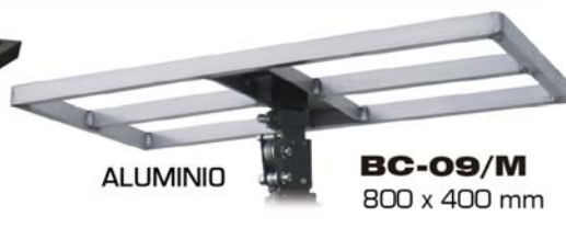
ALUMINIO BC-09/M 800 x 400 mm