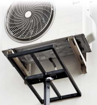
BC-02/M Adaptador Bandeja 80 x 40 cm (NO INCLUIDO)