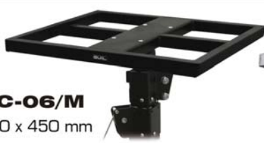
BC-06/M 450 x 450 mm